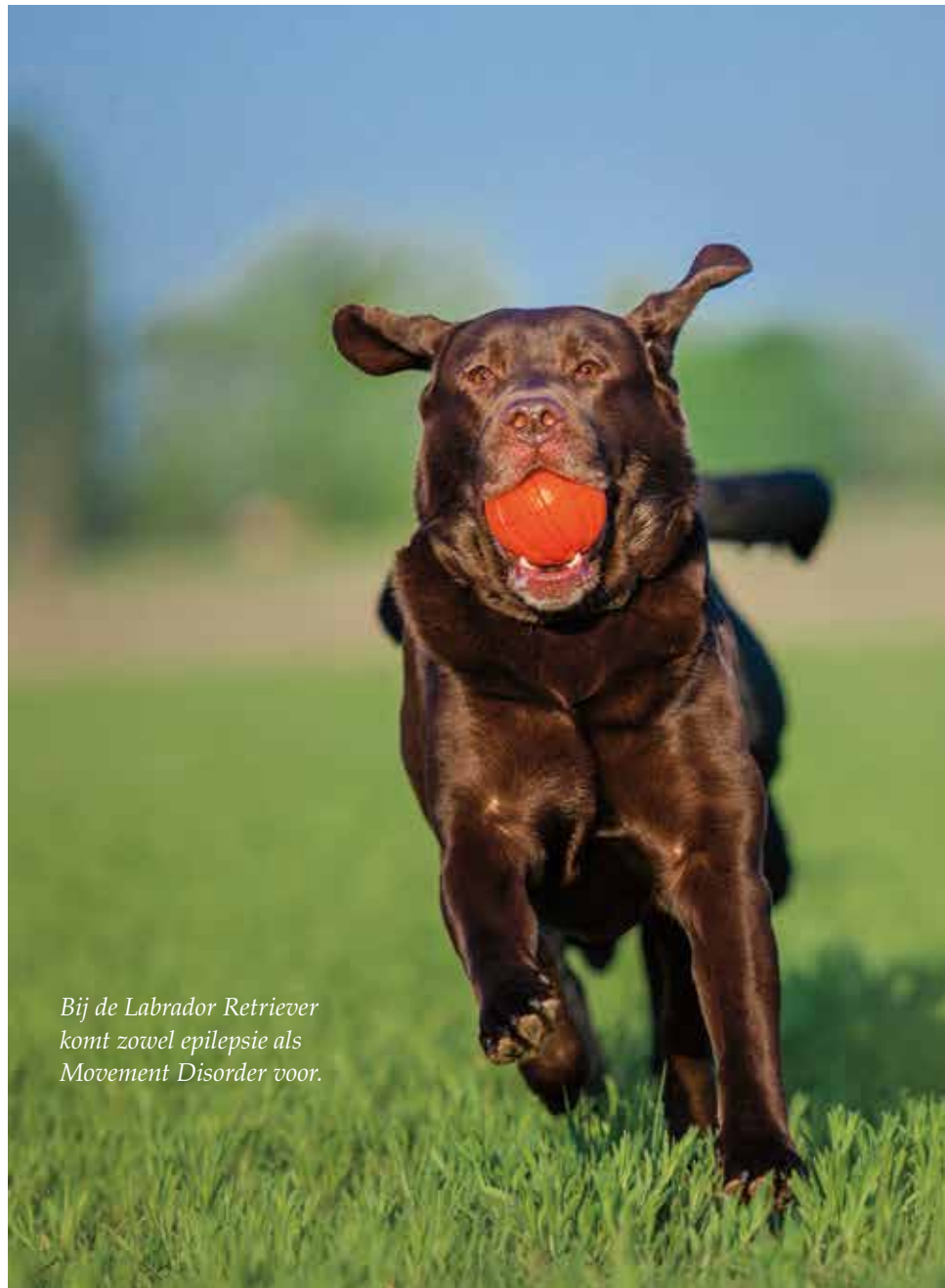
Bij de Labrador Retriever komt zowel epilepsie als Movement Disorder voor.